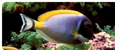
Poisson contaminé par Oodinium